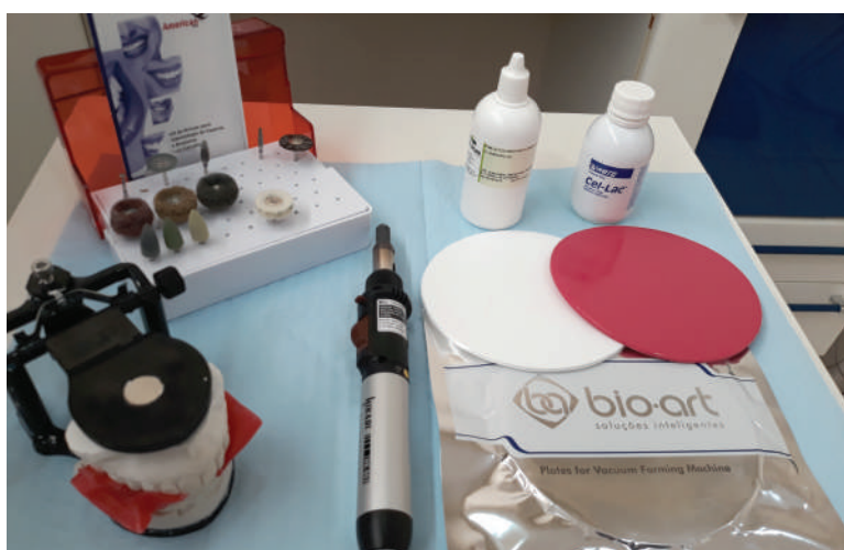
Foto 1 – Material utilizado - duas placas de 3mm de EVA (Etileno Vinil Acetato), sendo uma branca e outra rosa, da marca Bio-Art;

O uso de Protetor Bucal Individualizado é o mais indicado para proteção e deve ser confeccionado a partir da cópia das arcadas e dentes do atleta, possibilitando conforto, estabilidade e retenção, sem prejudicar sua respiração e deglutição.