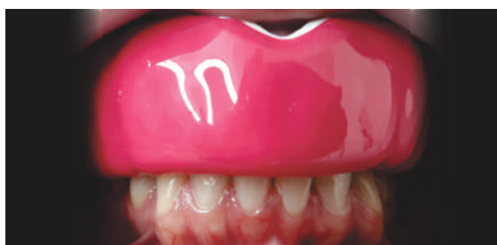
Foto 6 - Protetor Bucal Individualizado na boca da atleta.

Foto 5 - Protetor Bucal Individualizado finalizado.