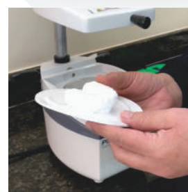
Foto 2 – Plastificação de placa de EVA branca em Plastificadora à Vácuo P7, da Bio-Art;