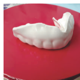
Foto 3 - Placa de EVA branca já plastificada e recortada com broca tipo lentilha e disco diamantado dupla face;