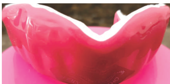
Foto 5 - Protetor Bucal Individualizado finalizado.

Foto 4 - Plastificação da placa de EVA rosa sobre a placa branca e acabamento com escova scotch brite;